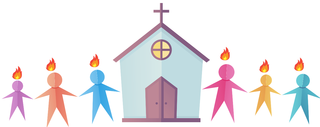
Imagen: (Anexo II, Imagen de la Iglesia)